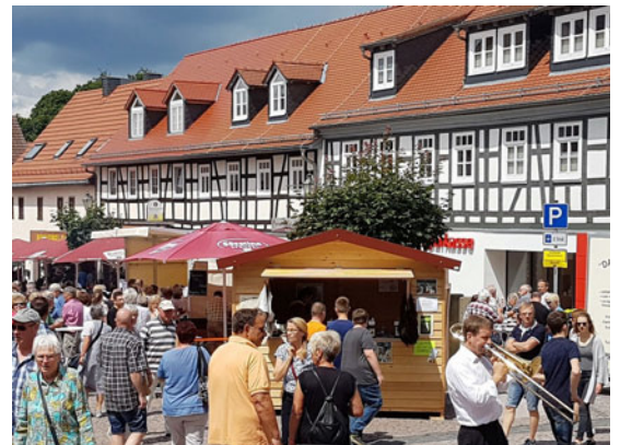
Wie überall in Gersfeld wird das Ortsbild auch am Marktplatz durch schicke Fachwerkhäuser geprägt.