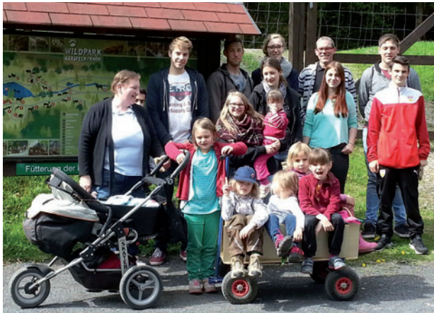
Wenn das Wetter es zulässt, haben die Kinderbetreuer auch für dieses Jahr wieder Ausflüge in die Umgebung geplant.

Mit dem Auto erreicht man Gersfeld recht gut über Autobahnen Richtung Fulda. Eine Wegbeschreibung mit Zimmerplan sowie ein detailliertes Programm schicken wir nach Eingang der Anmeldungen jedem zu. Auch mit dem Zug ist Gersfeld nach Umstieg in Fulda problemlos zu erreichen. Wer durch unsere Helfer vom Bahnhof Gersfeld abgeholt werden möchte, kann sich jederzeit unter 0177-410-9697 melden, um die Ankunftszeit mitzuteilen.