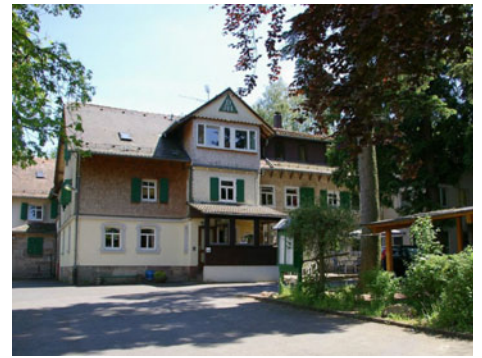
Durch ihren eher rustikalen Bau- und Einrichtungsstil ist die Jugendherberge Gersfeld für unseren Familienaufenthalt mit Kindern bestens geeignet. Wer auf eigene Kosten eher die Unterbringung in einer Pension oder einem Hotel bevorzugt, kann Möglichkeiten hierfür unter 02308/2324 erfahren. Für die Vorträge und Gesprächsrunden steht uns ab Samstag wieder der sehr moderne und geräumige Bürgersaal der Stadthalle zur Verfügung.

an Fanconi-Anämie nach kurzer Zeit dann kaum noch jemand.